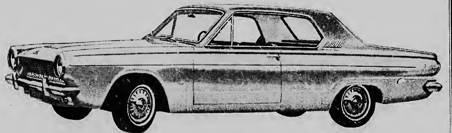
1963 DODGE DART GT.